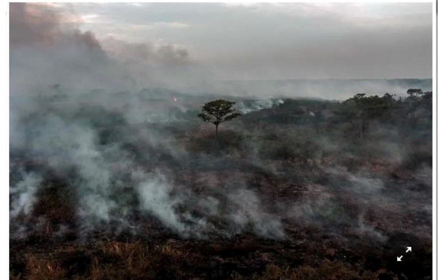
A forest fire burning in the Pantanal, Mato Grosso state, Brazil, last year.

Brazil had the largest share of tree loss last year, followed by the Democratic Republic of Congo and Bolivia. Indonesia showed improvement.