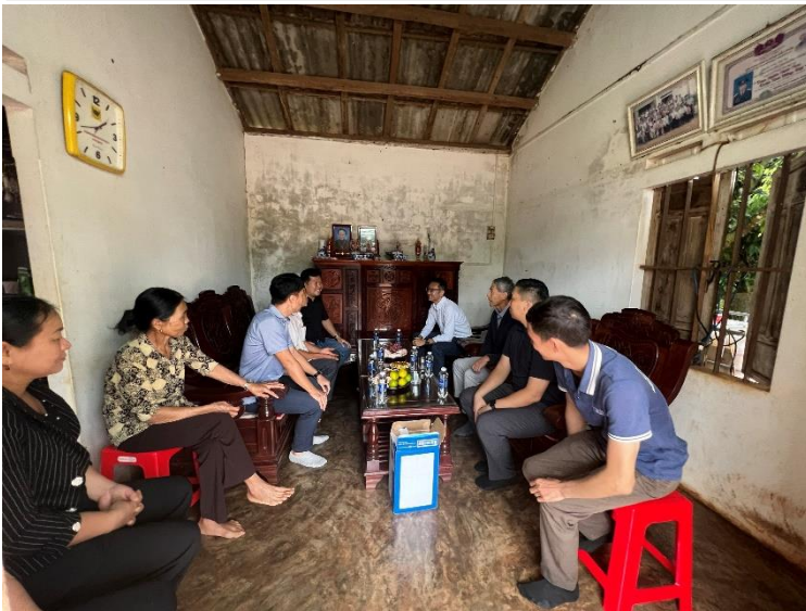
Thăm nông dân ở tỉnh Đắk Lắk